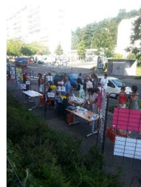
Centre Social de la Gravière - 2 septembre 2016

Les 2 et 8 septembre, animateurs et intervenants des différents ateliers ont présenté leurs activités dans une ambiance conviviale.